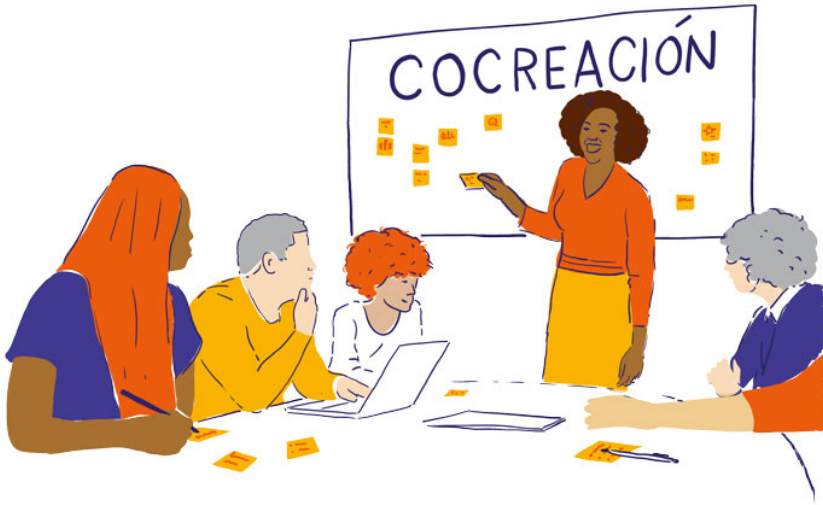
Imagen 2.2: Personas implicadas en el proceso de cocreación

El proceso de cocreación puede no ser lineal y, al igual que los modelos de coliderazgo, podría necesitar más tiempo o un compromiso económico superior. Sin embargo, la cocreación se puede entender como un proceso más largo que se centra en las soluciones a largo plazo, ya que es más probable que la cocreación garantice la sostenibilidad de programas y políticas. El proceso de cocreación ayuda a generar confianza entre las personas jóvenes y socias, porque todas las personas involucradas cultivan relaciones a través del proyecto. Esto puede llevar a una mayor colaboración futura. Adicionalmente, la cocreación permite la apropiación de las personas implicadas, porque cada participante ve sus propias ideas representadas en el proyecto. 31 La apropiación conjunta puede llevar a conseguir resultados más sostenibles, porque se implica a más personas en el éxito de un proyecto y en su continuación a largo plazo, si es necesario. Las personas socias y responsables de la toma de decisiones comprometidas en colaborar con la juventud entienden que los desequilibrios de poder pueden dificultar alcanzar un ritmo y un lenguaje comunes. Sin embargo, favorecer la agencia de las personas jóvenes puede ser tanto una solución a este reto como un resultado positivo.