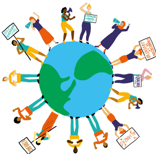
Imagen 1.2: La juventud ya está tomando medidas para actuar sobre los problemas más importantes en todo el mundo.

El modelo de Zvandiri, desde su fundación en 2004 por jóvenes con VIH conscientes de la necesidad de brindar asistencia entre pares y de empoderar a sus comunidades, ha sido adoptado por el Gobierno de Zimbabwe y ampliado por el Ministerio de Salud.