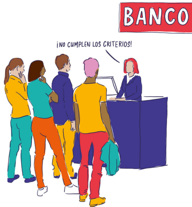
Imagen 3.3: Exclusión financiera

de todo el mundo —un grupo de población de 1800 millones de personas— no disponen de una cuenta bancaria básica en una institución financiera formal. Por ejemplo, aunque el 16 % de las personas jóvenes de los países de renta alta están excluidas desde el punto de vista financiero, más del 60 % de la juventud en África subsahariana, Oriente Medio, el norte de África, América Latina y el Caribe carece de acceso a los servicios financieros.