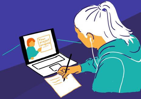
Imagen 3.5: Una persona beneficiaria del programa de Jóvenes Líderes participa en una reunión virtual de seguimiento