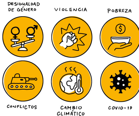
Imagen 1.1: Los problemas que afectan de manera desproporcionada a la juventud.

Vivimos en una era sin precedentes, marcada por los devastadores efectos del cambio climático, una pandemia mundial aún vigente y pobreza, conflictos, violencia y desigualdad de género persistentes. Estas problemáticas suelen afectar de manera desproporcionada a la juventud en todo el mundo.