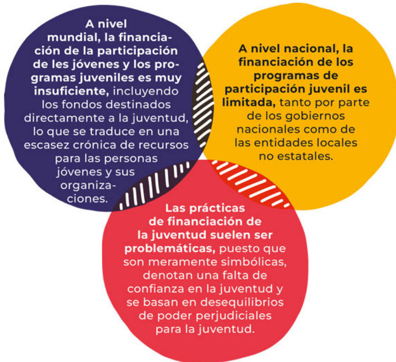
Imagen 3.1: Barreras para acceder a la financiación

Cuando la juventud recibe apoyo económico, tiene el potencial de desafiar normas perniciosas, impulsar reformas institucionales y legislativas y transformar sus comunidades. Sin embargo, la juventud hace frente a tres importantes obstáculos que dificultan el acceso equitativo a la financiación y su distribución, tanto a nivel mundial como nacional.