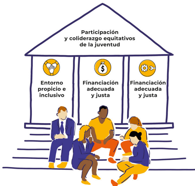
Imagen 2.1: Los pilares de la participación y el coliderazgo equitativos de la juventud.

Esto incluye el poder de diseñar y crear políticas, programas e iniciativas, de tomar decisiones y establecer agendas, así como de exigir que líderes y responsables de la toma de decisiones rindan cuentas.