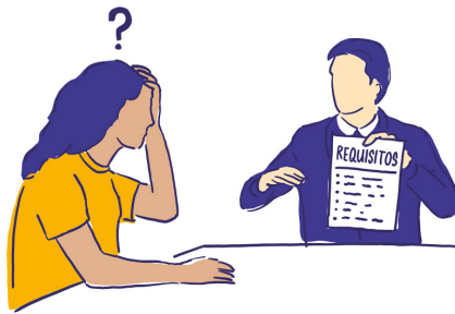
Imagen 3.4: La desigualdad en los criterios de financiación

grandes y consolidadas cuentan con las capacidades técnicas necesarias para cumplir los requisitos de financiación, pero no tienen conocimientos comunitarios para ponerlos en práctica o bien carecen de acceso a las comunidades, por lo que suelen recibir unos fondos que, de otro modo, habrían ido a parar a organizaciones comunitarias que sí cuentan con conocimientos a nivel local. Esto lleva a que las ONG internacionales u otras organizaciones no locales pongan en marcha programas que pueden no abordar las necesidades reales de la comunidad, especialmente las de las mujeres y las niñas.